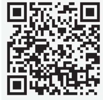
Ao apontar a câmera do celular para o QR Code, a edição abrirá automaticamente

“A única mudança é que a gente não vai para a rua. Pelo simples motivo de que ninguém deve ir à rua. Atendendo a isto, o jornal im-